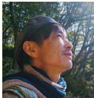
映画「つ・む・ぐ」 監督 シナリオ 撮影