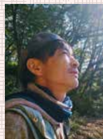
監督・シナリオ・撮影 吉岡 敏朗